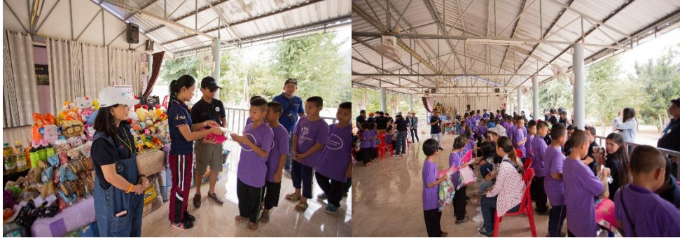
มอบทุนการศึกษา และสิ่งของจำเป็นให้แก่โรงเรียนตำรวจตระเวนชายแดน บ้านถ้ำหิน อำเภอสวนผึ้ง จังหวัดราชบุรี