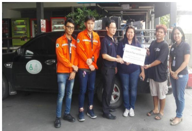
มอบเครื่องคอมพิวเตอร์ที่ไม่ใช้งานแล้วให้แก่สมาคมคนพิการทางการเคลื่อนไหว เพื่อนำไปรีไซเคิล วัสดุเพิ่มเติม สร้างมูลค่าเพิ่มและจำหน่ายเพื่อนำรายได้มาช่วยเหลือคนพิการต่อไป