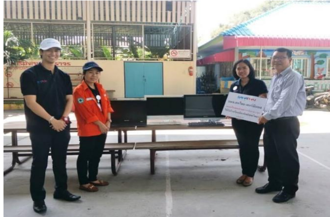
มอบเครื่องคอมพิวเตอร์ที่ไม่ใช้งานแล้วให้แก่โรงเรียนฉัตรทิพย์เทพวิทยา เพื่อใช้เป็นสื่อการเรียนการสอนให้กับเด็กนักเรียน