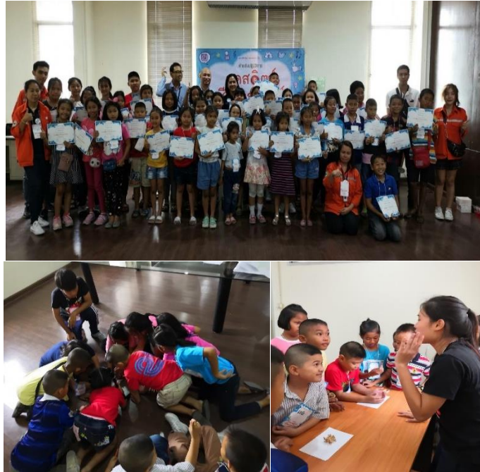
กิจกรรมโครงการค่าย Go Genius One Day Camp “ท่องโลกกว้างอย่าง Super Kids” ตอน”กตสวิษฐ์ ชีวิตออฟไลน์” จัดโดยสถาบันนามมีบุ๊ค อินโนเวชั่น

บริษัทฯ เล็งเห็นถึงวันสำคัญของเยาวชน จึงจัดกิจกรรมให้เด็กๆ ในโรงเรียนและแหล่งชุมชนใกล้เคียง เพื่อเป็นการสร้างความสุขให้กับเด็ก สามารถทำกิจกรรมได้อย่างสนุกสนาน และเกิดการเรียนรู้และพัฒนาตนเองอยู่ตลอดเวลาเพื่อเติบโตขึ้นมาเป็นผู้ใหญ่ที่มีคุณภาพ ผ่านการสนับสนุนการจัดกิจกรรมวันเด็ก กิจกรรมโครงการค่าย Go Genius One Day Camp เป็นต้น