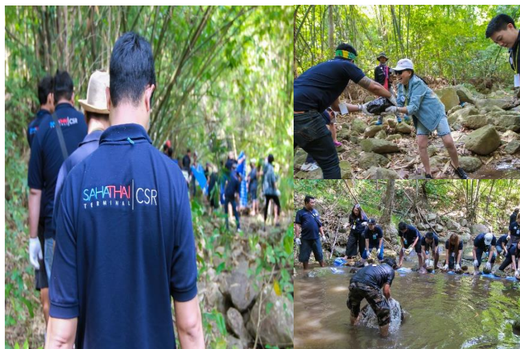
กิจกรรมสร้างฝายชะลอน้ำ ณ บ้านผาปก อำเภอสวนผึ้ง จังหวัดราชบุรี