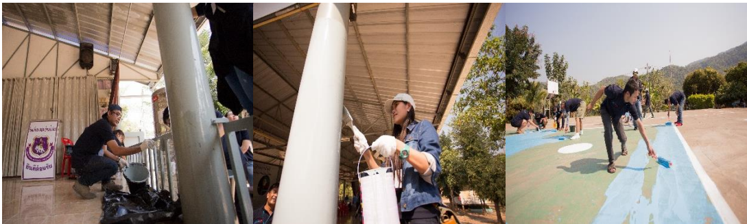
ซ่อมแซมอาคารเอนกประสงค์ และสนามกีฬาให้แก่โรงเรียนตำรวจตระเวนชายแดน บ้านถ้ำหิน อำเภอสวนผึ้ง จังหวัดราชบุรี