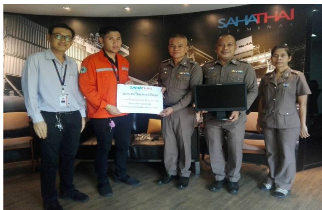
มอบเครื่องคอมพิวเตอร์ที่ไม่ใช้งานแล้วให้แก่ชุดปฏิบัติการชุมชนสัมพันธ์สถานีตำรวจภูธรตำบลสำโรงใต้ เพื่อใช้ในการงานชุมชนสัมพันธ์