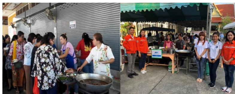
กิจกรรมออกโรงทานในงานเทศกาลสำคัญทางศาสนา