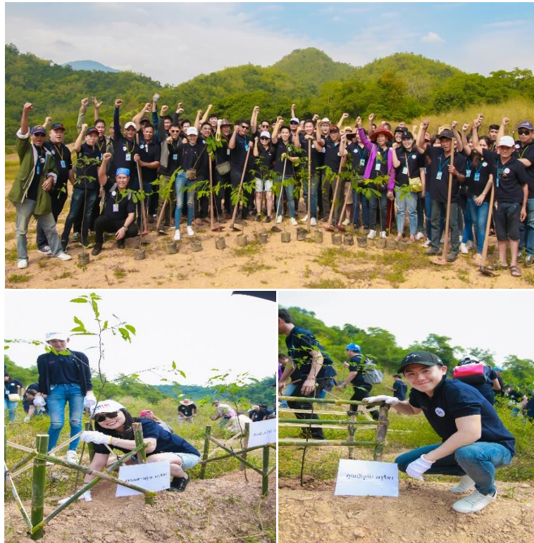
กิจกรรมปลูกป่า ณ หมู่บ้านห้วยผาก อำเภอสวนผึ้ง จังหวัดราชบุรี

บริษัทฯ ได้จัดกิจกรรมการปลูกป่า และสร้างฝายชะลอน้ำ เพื่อส่งเสริมความมีจิตสาธารณะของพนักงานและปลูกฝังจิตสำนึกในการอนุรักษ์ทรัพยากรธรรมชาติและป่าไม้ให้แก่ชุมชน ส่งเสริมการพัฒนาชุมชนโดยการมีส่วนร่วมของพนักงานและผู้บริหารของบริษัทฯ ด้วยสำนึกความรับผิดชอบต่อสังคม เพื่อให้คนในชุมชนได้มีน้ำสะอาดใช้ สามารถพึ่งพาตนเองได้ตามแนวเศรษฐกิจพอเพียง เป็นการสร้างความเข้มแข็งและความยั่งยืนให้กับชุมชน