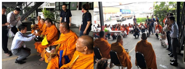
กิจกรรมทำบุญตักบาตรตามประเพณี และทุกวันจันทร์