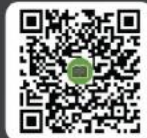
คู่มือการใช้งาน ระบบ IR PLUS AGM TH และ ENG