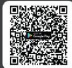
ดาวน์โหลด Application IR PLUS AGM ระบบ Android Ver. 9 ขึ้นไป