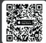
ดาวน์โหลด Application IR PLUS AGM ระบบ iOS 15 ขึ้นไป

ในวันประชุม ผู้ถือหุ้น/ผู้รับมอบฉันทะ Log in เข้าสู่ระบบ IR PLUS AGM กรอกรหัส Pincode 6 หลัก เพื่อลงคะแนนเข้าร่วมประชุม